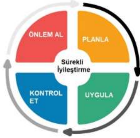
Şekil 1. PUKÖ Döngüsü

Planla: Otelimiz çevre, toplum, kültür, ülke ekonomisi ve yönetim sistemi konularına önem vermekte ve hedefler belirlemektedir. Belirlenen hedeflere ulaşabilmek için izlenecek yol haritası ve eylemleri planlamaktadır.